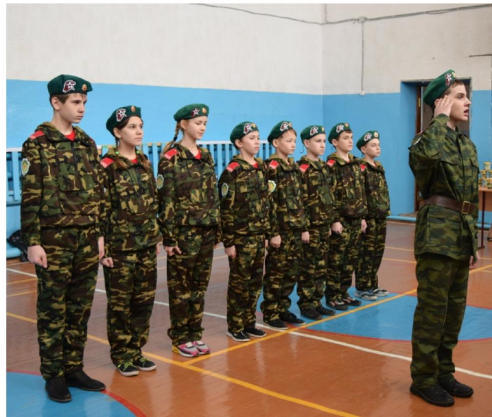
Соревнования и эстафеты