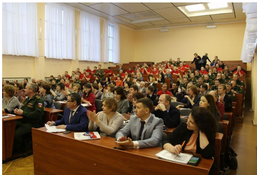
Открытый слёт военно-патриотических отрядов